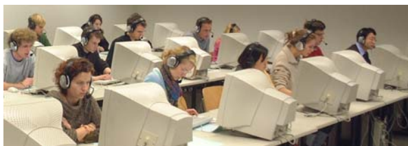
Internet-TOEFL: größtes Testzentrum in Deutschland mit ca. 2500 Prüfungen 2006

Das IIK ist regional größtes Prüfungszentrum für den TestDaF (die neue, weltweit einheitliche Sprachzugangsprüfung für Studienbewerber in Deutschland), den TOEIC (berufsbezogenes Englisch) und dem TOEFL (Englischprüfung für Studienbewerber in englischsprachigen Ländern). Bei diesem weltweit führenden akademischen Sprachtest hat das IIK 2005 er-