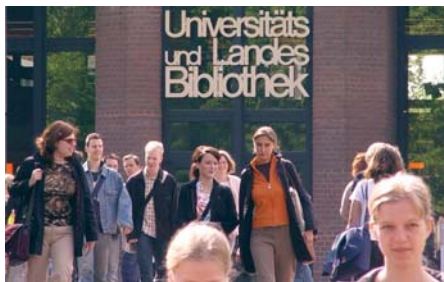
IIK und Hochschule(n)

Auf der anderen Seite entwickelt sich das IIK immer mehr zu einem Dienstleister für alle Fakultäten der Heinrich-Heine-Universität, dem Universitätsklinikum, aber auch anderen Düsseldorfer Hochschulen. So sind in der Mitgliedschaft des IIK e.V. mittlerweile alle Fakultäten vertreten, existieren gute Beziehungen zu anderen Weiterbildungsstellen innerhalb der Universität, etwa zum Bildungszentrum des Universitätsklinikums oder der Düsseldorf Business School, und präsentierte sich das IIK zusammen mit anderen Weiterbildungsangeboten an der und um die Heinrich-Heine-Universität auf dem "Tag der Forschung" am 15.11.2005.